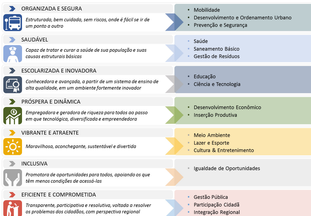
Figura 1: Áreas de resultado e focos estratégicos do NQQ

Por sua vez, as diretrizes de cada ano são estabelecidas pelos Planos de Metas Anuais pactuados com cada um dos órgãos e entidades e a alocação de recursos pelos Planos de Diretrizes Orçamentárias (LDO) e Planos Orçamentários Anuais (LOA) possibilitando o alinhamento entre os diferentes panoramas temporais que compõem a estratégia de planejamento municipal.